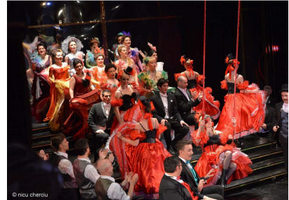
Scenă din actul al III-lea

Scenografia reputatei artiste Viorica Petrovici s-a restrâns la delimitarea unui spațiu simetric, în care o mare scară centrală a avut în laturile scenei decoruri stilizate, construite din simple profile metalice, întrucâtva modificate între acte. Ingeniozitatea a venit prin fundalul rezervat unei oglinzi translucide care a dat interesante efecte de forme și lumini. Spectacolul scenic vizual s-a remarcat însă prin costumele desenate de aceeași Viorica Petrovici, recunoscută maestră a design-ului vestimentar în producțiile de operă și nu numai. Să nu uităm că artista a fost nominalizată acum doi ani la unul dintre Premiile César.