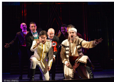
Scenă din actul al II-lea